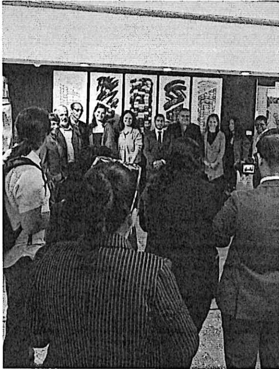
El público tomando fotos a los artistas homenajeados de la noche.