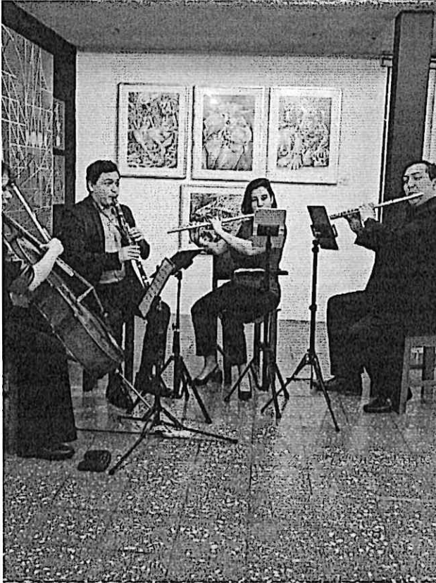
Iniciando el concierto con la pieza Salu't de amore del compositor Elgar.