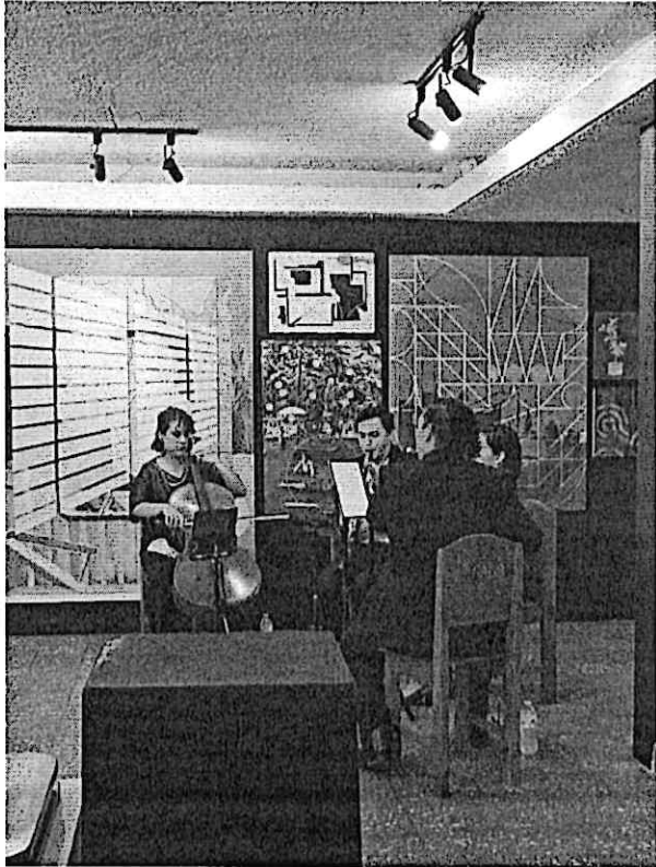
Interpretando la nostalgica pieza "Noche de luna entre ruinas" del compositor Mariano Valverde